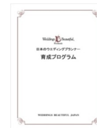
日本のウエディングプランナー 育成プログラム (テキスト)