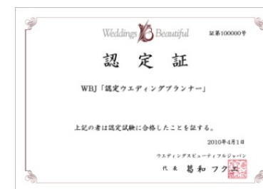
WBJ「認定ウエディングプランナー」 認定証

WBJ「認定ウエディングプランナー」はウエディングプランナーの真の力をつけた証に取得できる資格です。